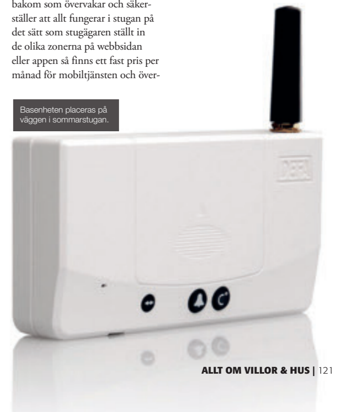
Basenheten placeras på väggen i sommarstugan.

och då ingår allt man behöver för att komma i gång. En basenhet med förinstallerat SIM-kort och en trådlös stickkontakt. Eftersom GSM mobildataSIM-kort ingår med abonnemang och en tjänst bakom som övervakar och säkerställer att allt fungerar i stugan på det sätt som stugägaren ställt in de olika zonerna på webbsidan eller appen så finns ett fast pris per månad för mobiltjänsten och över-